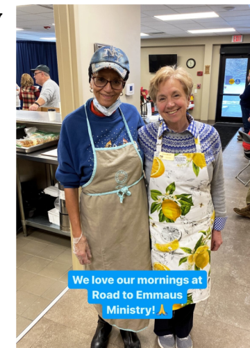
We love our mornings at Road to Emmaus Ministry!